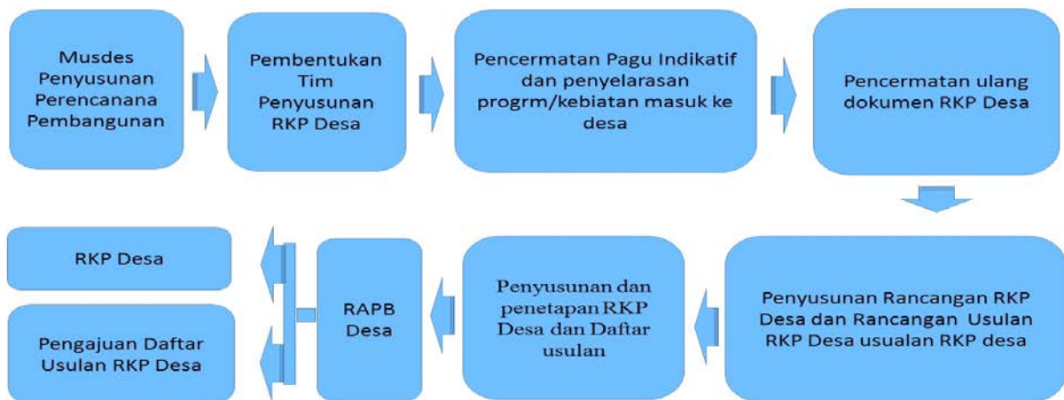
Gambar 2. Mekanisme Tahapan Penyusunan RKP Desa

Tahap ini dilakukan untuk mengintegrasikan kegiatan-kegiatan RPB (Rencana Penanggulangan Bencana) dalam RKP Desa sesuai dengan program-program yang direncanakan dalam RPJM Desa. RKP Desa merupakan penjabaran kegiatan detail yang disusun setiap tahun dan program tahunan yang akan berjalan.